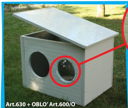
Art.630 + OBLO' Art.600/O